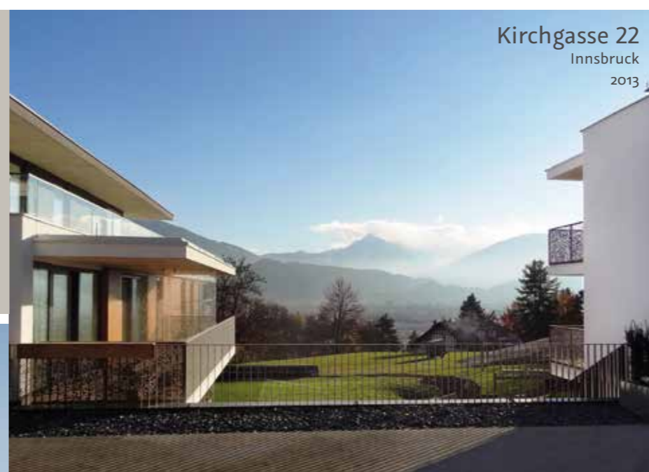
Kirchgasse 22 Innsbruck 2013