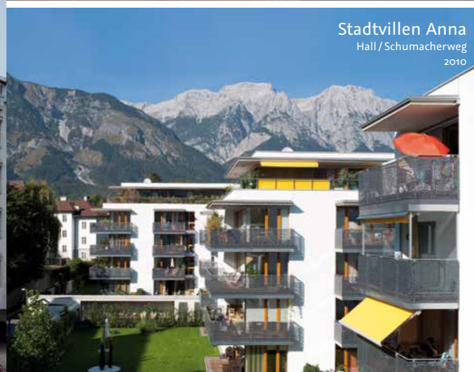
Stadtvillen Anna Hall / Schumacherweg 2010