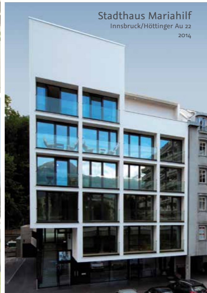
Stadthaus Mariahilf Innsbruck/Höttinger Au 22 2014