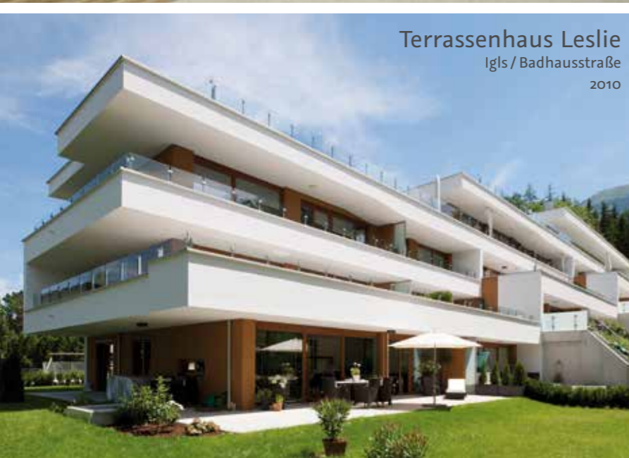
Terrassenhaus Leslie Iglis / Badhausstraße 2010