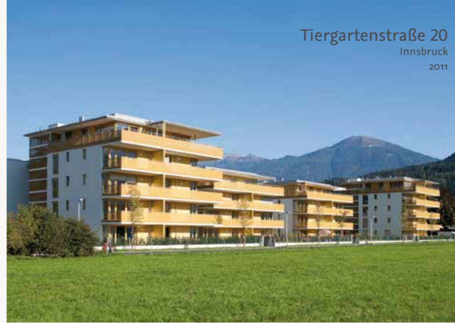
Tiergartenstraße 20 Innsbruck 2011