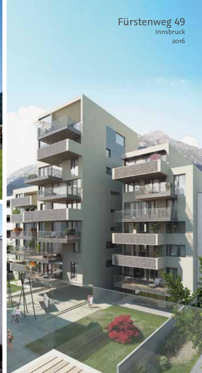
Fürstenweg 49 Innsbruck 2016